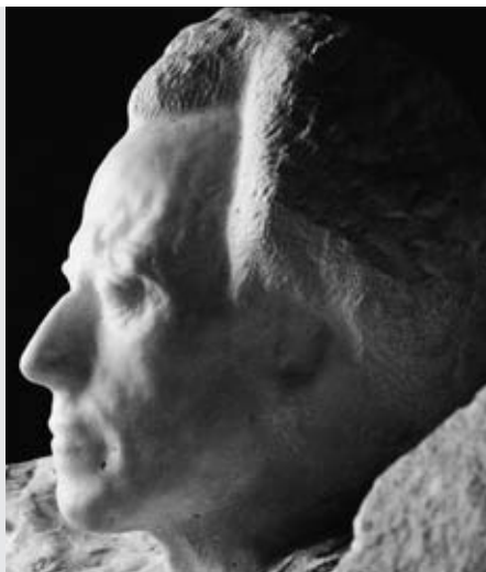
(da Gustav Mahler , a cura di Franco Pulcini in collaborazione con Gastón Fournier-Facio, Torino, De Sono, 2007, p. 95)

Nel 1909, poco dopo aver terminato la stesura della Nona Sinfonia , Mahler posò a Parigi per lo scultore Auguste Rodin: una testa in marmo derivata da una serie di bronzi preparatori. L'artista francese intitolò il lavoro Mozart , sia per immortalare una somiglianza rilevata durante la posa, sia per ricordare una splendida rappresentazione delle Nozze di Figaro diretta, appunto, da Gustav Mahler. Non avrebbe, però, mai immaginato che «Mozart!! Mozart!!» (il vezzeggiativo di Mozart) sarebbero state le ultime parole pronunciate nel 1911 dal compositore sul letto di morte. Oggi l'opera d'arte è conservata a Parigi, presso il Musée Rodin.