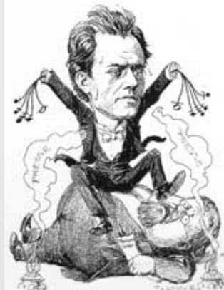
(da Gustav Mahler , a cura di F. Pulcini, Torino, De Sono, 2007, p. 4)

tendesse soltanto una rapida trascrizione su carta. Dopo l'estate la partitura fu rivista e strumentata, e il 25 novembre del 1901 era pronta per essere aperta sui leggi della Tonhalle di Monaco di Baviera: un'esecuzione che sarebbe stata presto replicata a Berlino (16 dicembre) e Vienna (18 gennaio 1902).